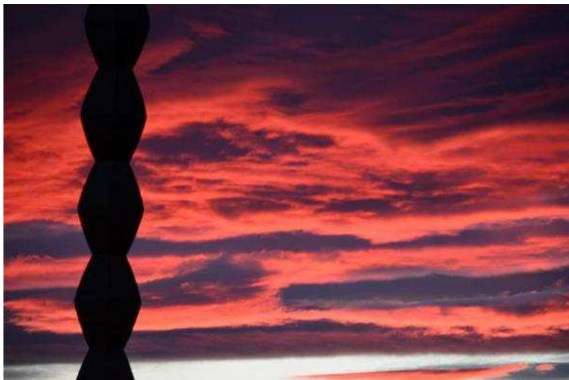
„Dans Pasional”, Foto Liviu Crăciun, Acryl, 75 cm x 50 cm

Imaginile prezentate în dia show au fost surprinse la Târgu Jiu, Paris, Mannheim și... la Hobița, la casa memorială a artistului. Câteva fotografii făcute la Sarmisegetusa Regia s-au integrat organic în ansamblu, făcând trimiterea spre obârșiile ancestrale din care și-a extras artistul sevele.