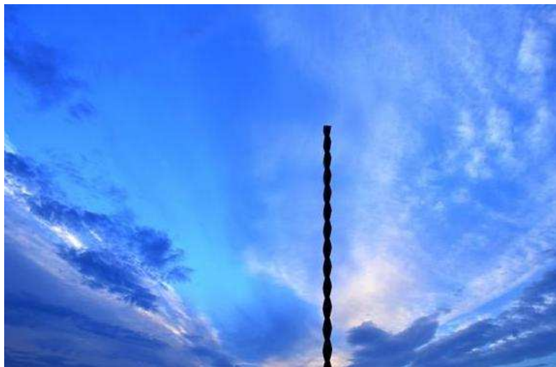
„Fluturile în Lumină”, Foto Liviu Crăciun, Acryl, 75 cm x 50 cm

Este expusă colecția de fotografii cu titlul ”Omagiu lui Constantin Brâncuși”, fotografii realizate de Liviu Crăciun, Germania.